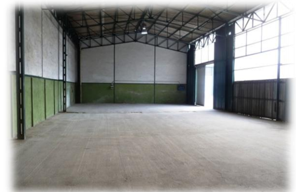
Magazzino D ( 240 mq)