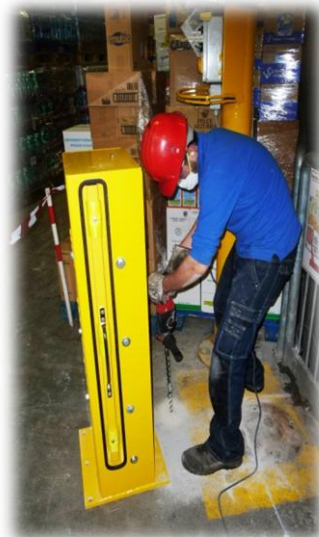
Montaggio c/o Utenza Esterna