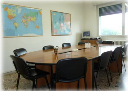
Sala Disponibile per Riunioni