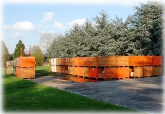
Deposito Esterno in Area “ E3 ”