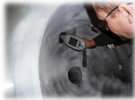
Controllo e Collaudo PMI