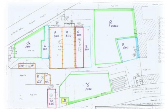
Planimetria Aree Funzionali