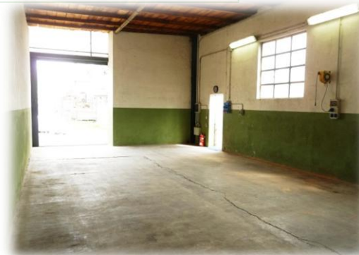
Magazzino F ( 80 mq)