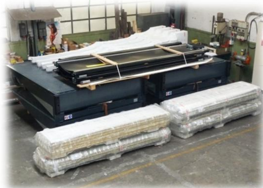
Stoccaggio Magazzino “ A ”

Superfici disponibili in Spazi Comuni o in Spazi Riservati e dedicati