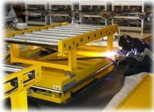
Saldatura Componenti di Impianto Capannone A