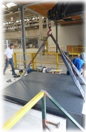
Installazione c/o Utenza Esterna