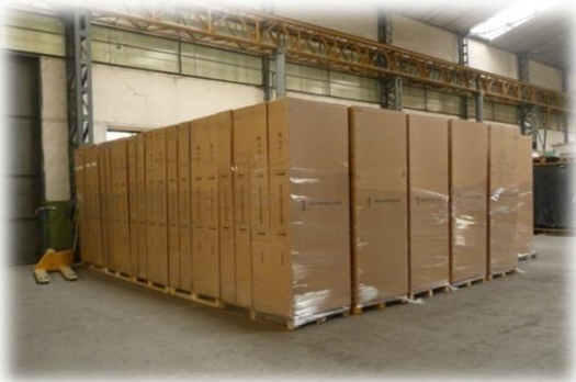
Stoccaggio Magazzino “ B ”

Disponibilità ed allocamenti al Coperto e/o allo Scoperto , a partire da 1 mq.