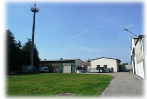
Ingresso Zona Carico / Scarico Merci

- Effettuare su Vs. specifiche Assemblaggi Montaggi e Collaudi , sia in sito che a destino finale.