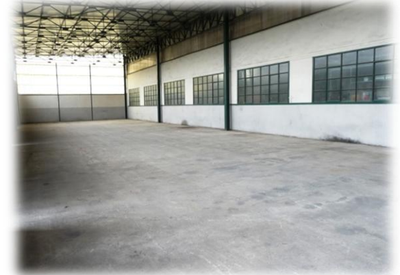
Magazzino C ( 360 mq)