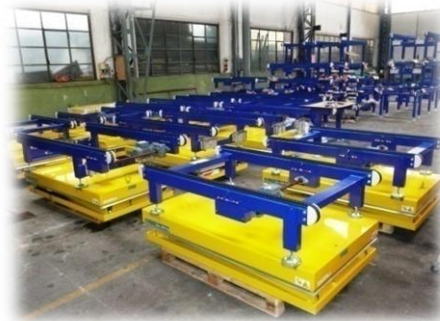
Stoccaggio Elementi Impianto Magazzino “ B “