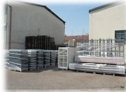
Deposito Esterno Area “ Alfa “